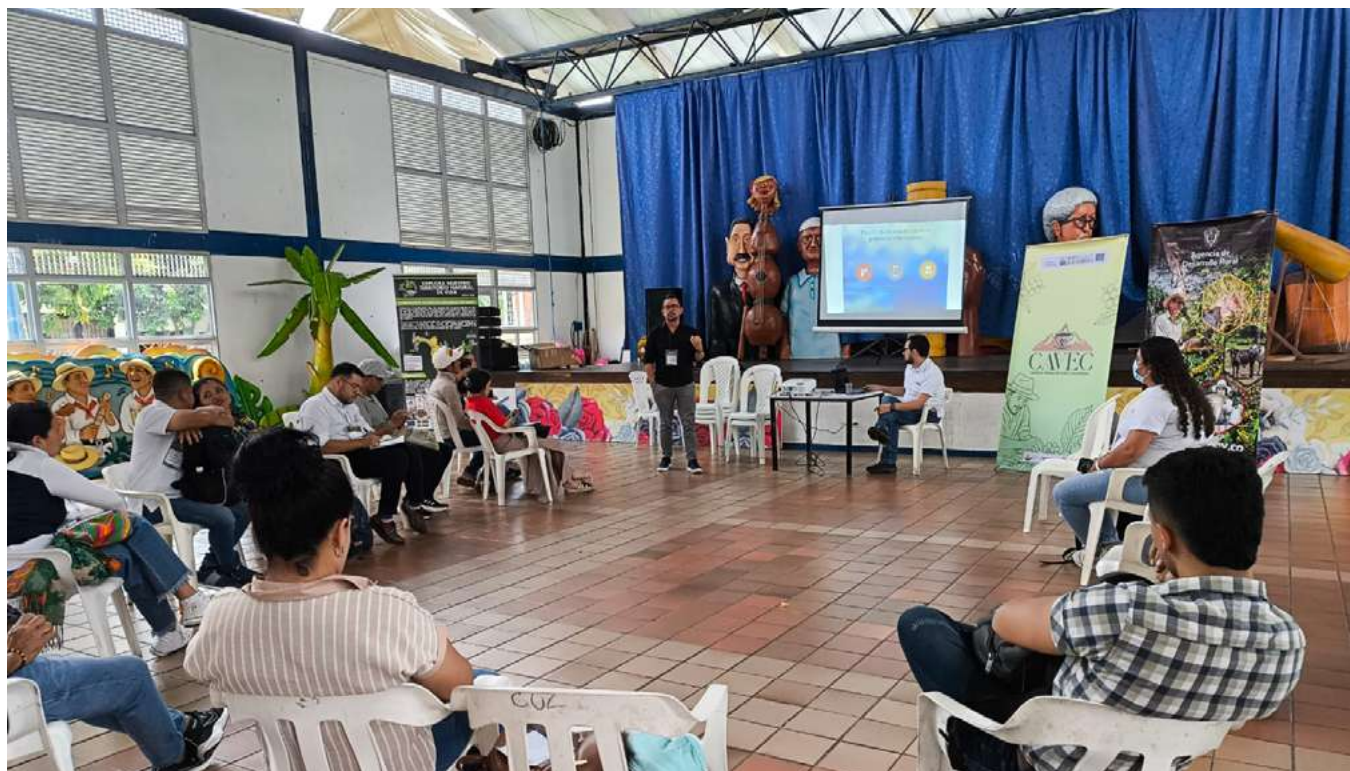
Utbildning för kaffeproducenter i Colombia.

Sammantaget visar dessa exempel en tydlig förändring: rättighetsbärare deltar inte bara, utan utvecklar också egna lösningar, engagerar institutioner och skapar mekanismer som förbättrar tillgången till rättigheter, tjänster och ansvarsutkrävande.