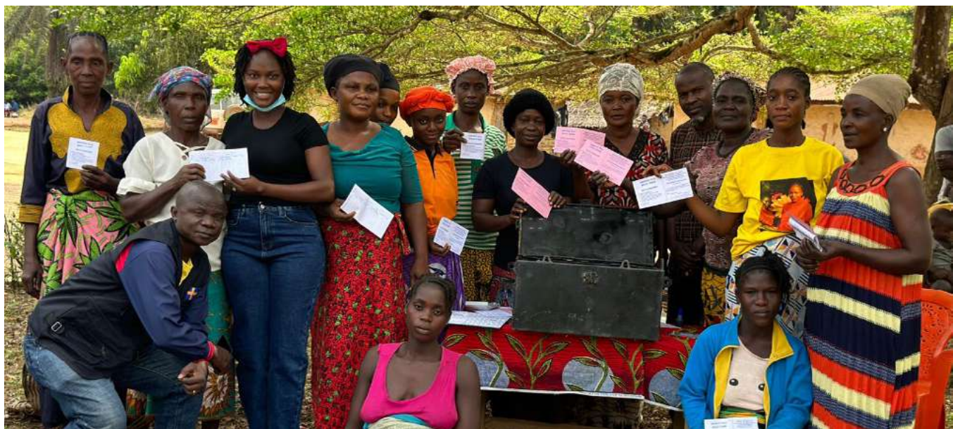
Kvinnor i Wulu Town i Liberia stärker sin ekonomiska självständighet genom spar- och lånegrupper, där de tillsammans skapar bättre möjligheter för sina familjer och sin framtid.

I Liberia vid en nationell konferens om SRHR (sexuell och reproduktiv hälsa och rättigheter) betonade vi rätten till kroppslig autonomi och stärkte därmed kvinnors egenmakt som en central del av demokrati och mänskliga rättigheter.