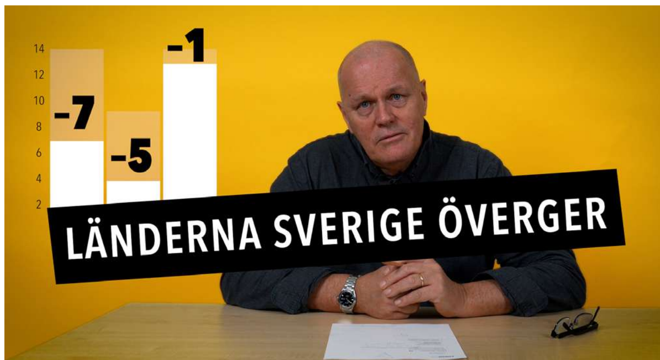
I vår nya YouTube-serie Biståndsnytt förklarar vi vad som händer med svenskt bistånd och hur politiska beslut påverkar människor runt om i världen.

Regional Office Latin America and the Caribbean (ROLAC) har tillsammans med partnerorganisationerna Cospe och CCPR, bidragit till att uppmärksamma frågor som rör föreningsfrihet och rätten till fredliga sammankomster genom två globala evenemang med representation från högnivådelegationer från EU och FN; formellt inspel till General Comment om artikel 38 om föreningsfrihet; samt genom att sprida resultaten från de nio Country Analysis and Assessment (CARA)-rapporter som producerades 2025.